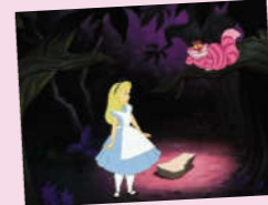
(时隐时现,总是挂着一张笑脸的柴郡猫。)

3 他们继续在洞里历险,她的身体总是忽大忽小地变化着。她热心地帮助兔子寻找丢失的手套和扇子,却被当成了女佣人;她在公爵夫人的厨房里放走了可能被杀掉的小宝宝;她遇见了总是挂着笑脸,时隐时现把人搞得头脑发晕的柴郡猫。在疯茶会上,她和疯疯癫癫的帽匠、三月兔讨论了时间问题……无数奇幻的经历让小爱丽丝觉得自己做好了准备,她用金钥匙打开了通往花园的大门。