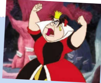
(红桃皇后真是脾气暴躁的家伙。)

4 一张张能说会道,性格鲜明的扑克牌是这个世界的角色,爱丽丝在玫瑰园遇到了骄横的红桃皇后,这位坏脾气的王后最喜欢说的话就是:“剁掉他的脑袋。”她与王后打了一场怪异的槌球赛;欣赏了假海龟和鹰头狮跳的龙虾四对舞;在与形形色色怪异角色的奇遇中,天真的爱丽丝的脑中涌现出了越来越多的奇思妙想。