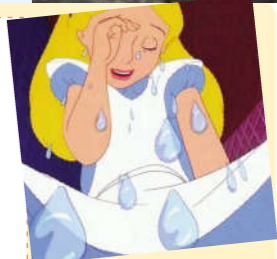
(变成巨人的爱丽丝,她的眼泪汇成了一个池塘。)

2 她在洞里掉啊,掉啊,掉到一个四周都有门的门厅,这里充满了新奇怪异的事物。味道美妙的“喝我”饮料让她变成了十英寸的小人,“吃我”蛋糕又让她长成了九英尺的巨人。攥着兔子的扇子,她缩成了二英寸的小不点,还跌进了自己是巨人时哭出的“眼泪池”里。在海一般的眼泪池中,爱丽丝结识了耗子、渡渡鸟等神奇的小动物。