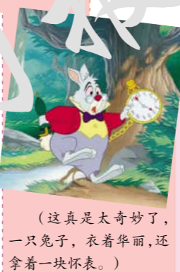
(这真是太奇妙了,一只兔子,衣着华丽,还拿着一块怀表。)

1 爱丽丝是一个七岁的小女孩,她天真活泼,对世界满怀好奇,诚实而富有同情心。一个晴朗的秋日里,爱丽丝和姐姐正在草地上看书。忽然,一只自言自语,身穿背心的兔子匆匆跑过。这一幕吸引了好奇的爱丽丝,她毫不犹豫地跟着它跳进了兔子洞。就这样,奇妙的漫游开始了!