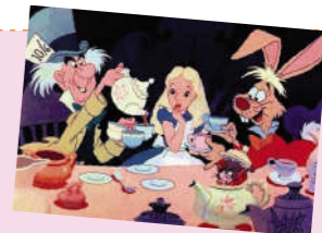
(疯茶会上,爱丽丝结识了疯帽匠、三月兔和睡鼠。)

5 “——啊!”爱丽丝发出一声尖叫,却发现是做了一个长长的梦,姐姐正把落在她身上的树叶掸掉呢。